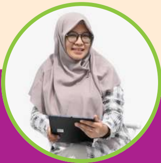
Infra Megawaty S.I.B